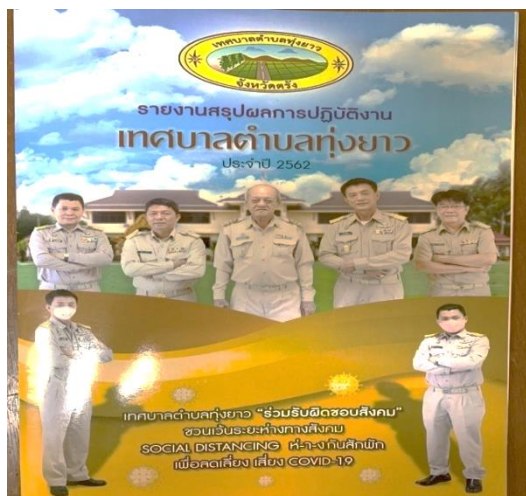
๒๑. โครงการบำรุงรักษาระบบเว็บไซต์ของเทศบาลตำบลทุ่งยาว