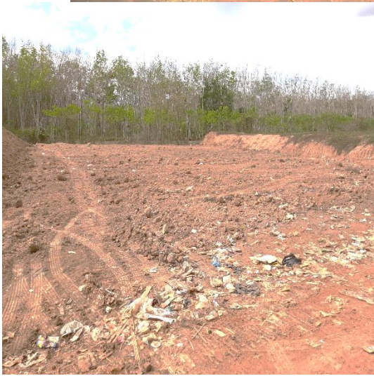
๓๐. โครงการจัดการขยะมูลฝอย