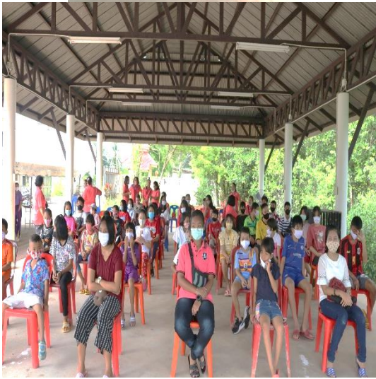
๑๒. โครงการป้องกันโรคไข้เลือดออก