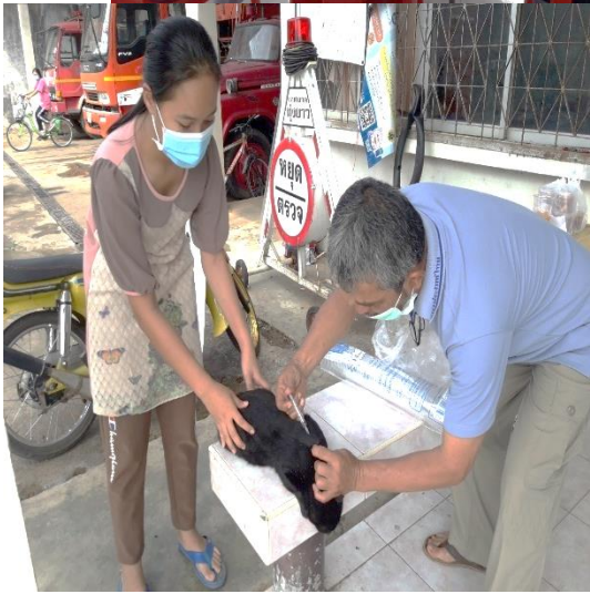
๑๕. โครงการสุขาภิบาลอาหาร