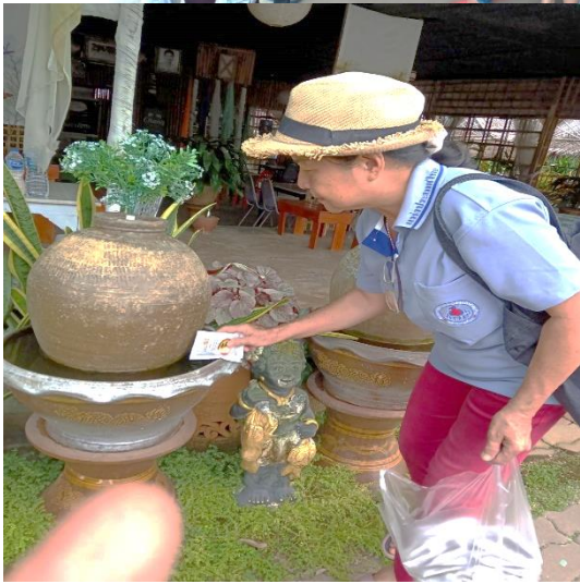
๑๓. โครงการส่งเสริมสุขภาพ ๕ กลุ่มวัย