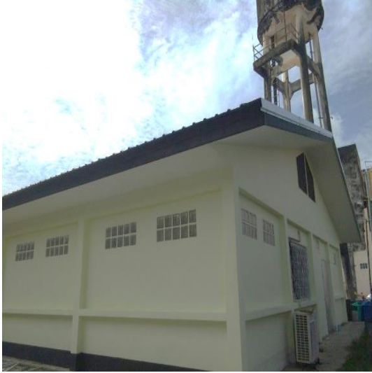
๒๗. โครงการก่อสร้างศาลาอเนกประสงค์บริเวณสนามเด็กเล่น