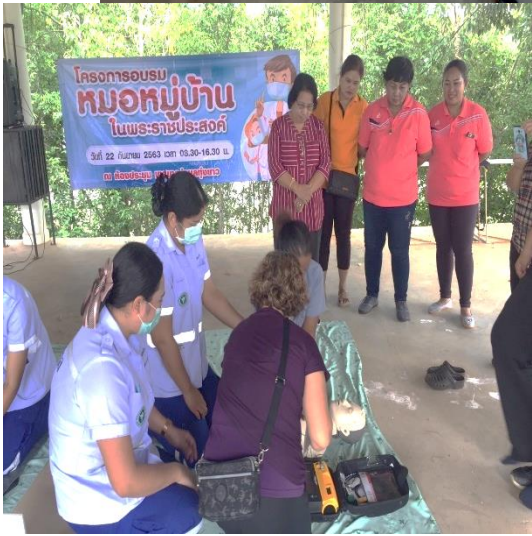
๑๐. โครงการพัฒนาศักยภาพผู้สูงอายุและผู้พิการ