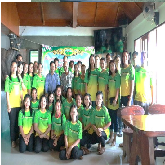
๒๐. โครงการจัดทำวารสารเทศบาล