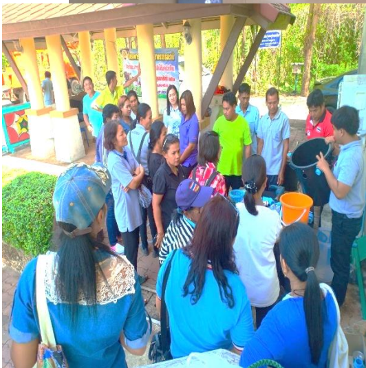
๓๓. โครงการอนุรักษ์และสืบสานประเพณีตรุษจีน